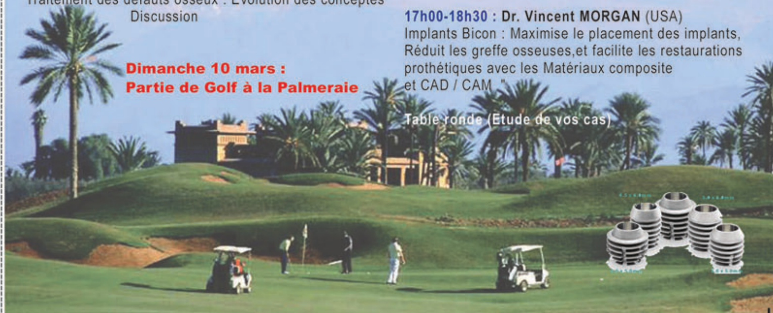
Table ronde (Étude de vos cas)

17h00-18h30 : Dr. Vincent MORGAN (USA) Implants Bicon : Maximise le placement des implants, Réduit les greffe osseuses, et facilite les restaurations prothétiques avec les Matériaux composite et CAD / CAM "